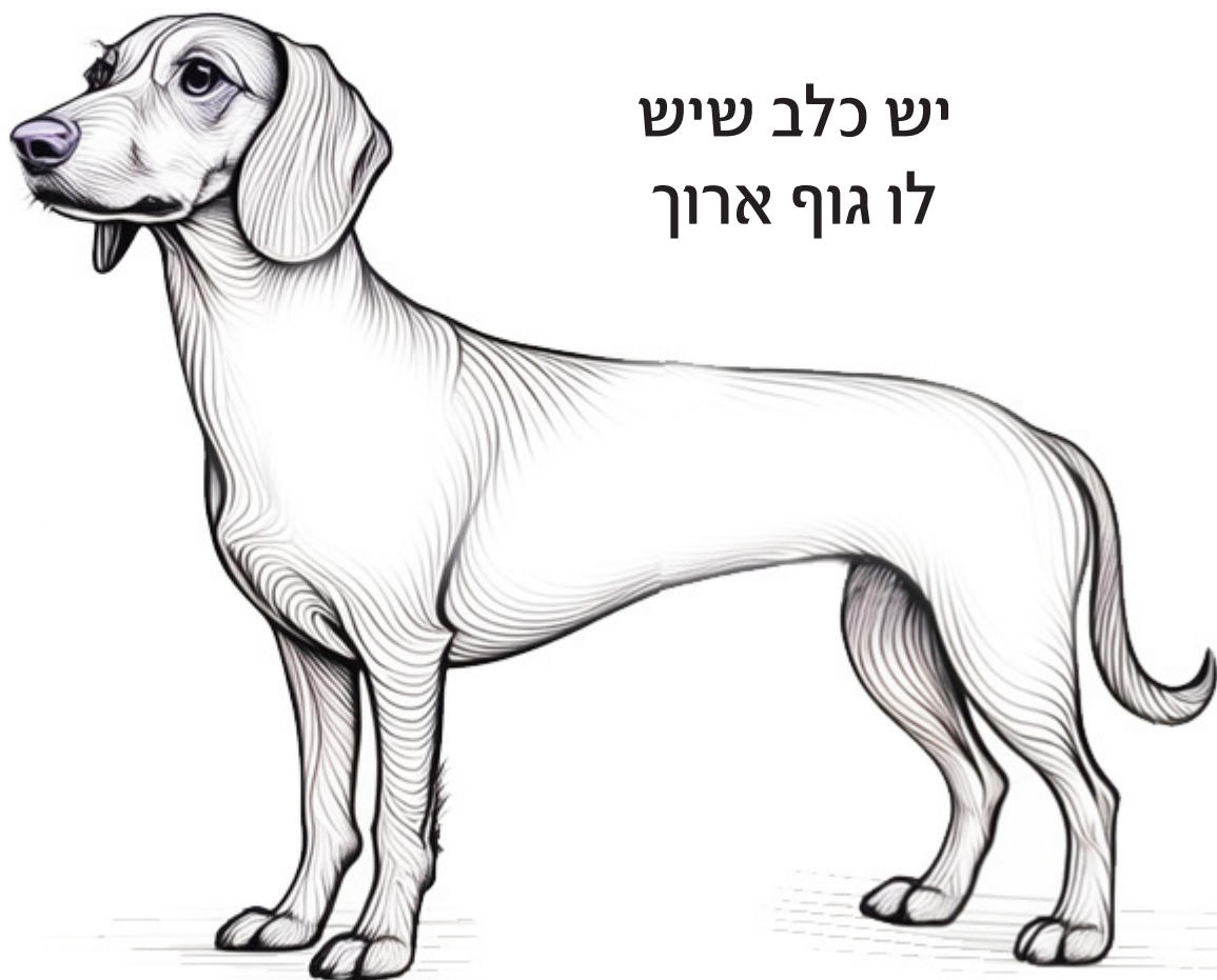
יש כלב שיש לו גוף ארוך