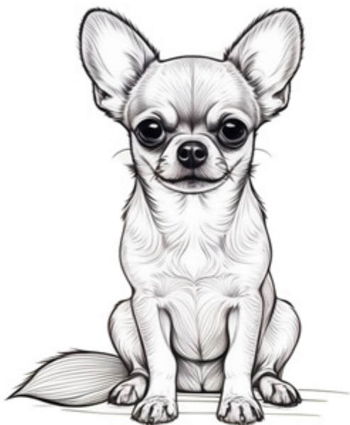
יש כלב שיש לו גוף קצר